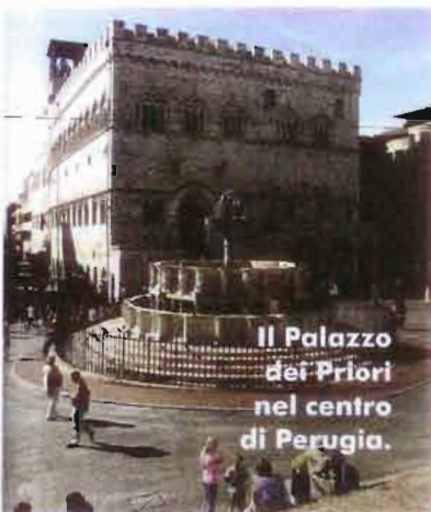
Il Palazzo dei Priori nel centro di Perugia.