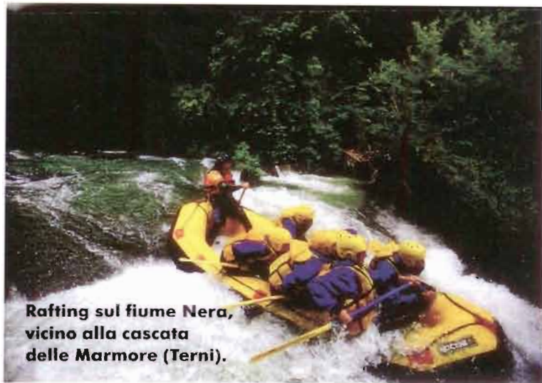
Rafting sul fiume Nera, vicino alla cascata delle Marmore (Terni).