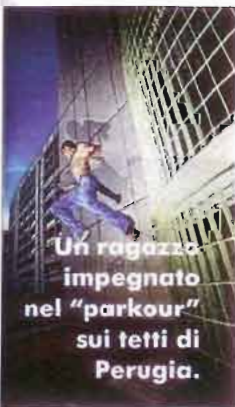
Un ragazzo impegnato nel "parkour" sui tetti di Perugia.