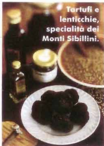
Tartufi e lenticchie, specialità dei Monti Sibillini.