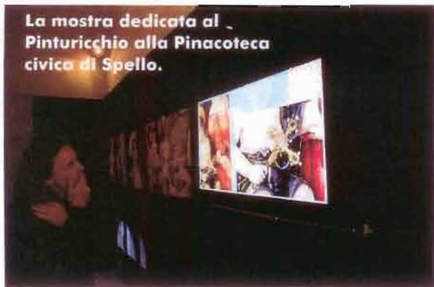
La mostra dedicata al Pinturicchio alla Pinacoteca civica di Spello.